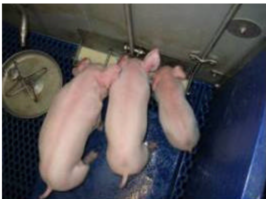
Abbildung. 4: Ferkel an der Milchbeifütterung

Neben den Leistungsparametern wurden Untersuchungen zur Verhaltensbeobachtung der Ferkel an der Milchbeifütterung durchgeführt. Diese Ergebnisse werden im zweiten Teil des Newsletters erscheinen.