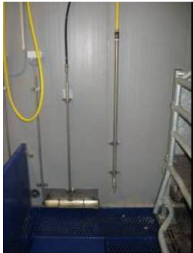
Abbildung. 2: Kipptrog mit Sensor