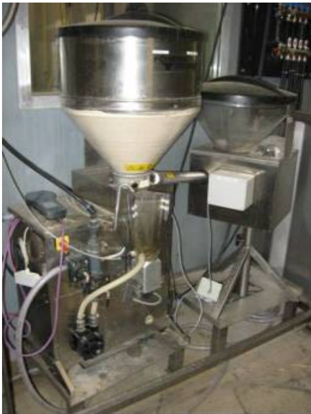
Abbildung. 1: Baby-Milk-Mix-Feeder

Im ersten Teil werden die biologischen Ergebnisse der Gesundheits- und Leistungsmerkmale der Sauen und Ferkel vorgestellt. Untersucht wurde die Zahl der abgesetzten Ferkel, die Verluste in der Säugephase, die Gewichtsentwicklung der Ferkel und die Entwicklung der Muttersau.